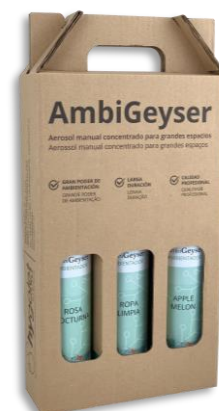
Estuche muestrario de 3 fragancias. Consultar.

Leer la información del envase y consultar la ficha de seguridad.